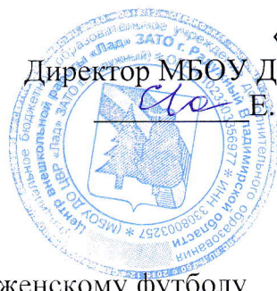
График проведения занятий по женскому футболу